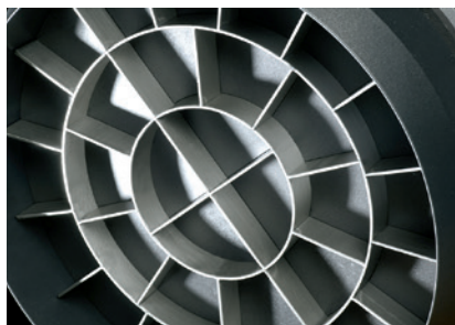
Disco divisor de aluminio con cuchilla de acero inoxidable.