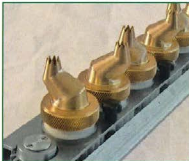
BECCUCCI GIREVOLI ROTATIVE NOZZLES DOUILLES TOURNANTES