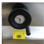
Regulación manual altura de la mesa