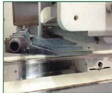
TAGLIO A FILO WIRECUT COUPE A FILE

DELFIN Srl Via Keplero, 18 – 36034 MALO (VI) Italia Tel. +39 0445 580688 E-mail: info@delfin.it www.delfin.it