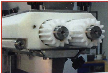
TESTA A POMPA PUMP HEAD TETE A POMPE