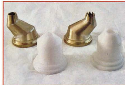
BECCUCCI GIREVOLI ROTATIVE NOZZLES DOUILLES TOURNANTES