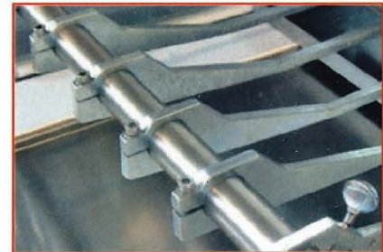
TAGLIO A FILO WIRECUT COUPE A FILE

DELFIN Srl Via Keplero, 18 – 36034 MALO (VI) Italia Tel. +39 0445 580688 E-mail: info@delfin.it www.delfin.it