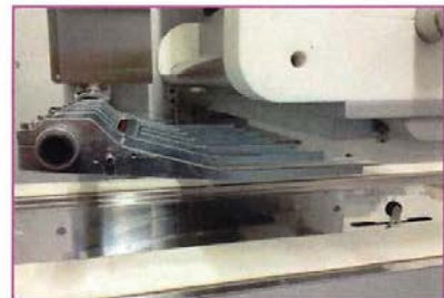
TAGLIO A FILO WIRECUT COUPE A FILE

DELFIN Srl Via Keplero, 18 – 36034 MALO (VI) Italia Tel. +39 0445 580688 E-mail: info@delfin.it www.delfin.it