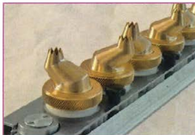
BECCUCCI GIREVOLI ROTATING NOZZLES DOUILLES TOURNANTES