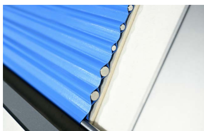
Alfombra de rodillos con resorte de uso alimentario; fácilmente intercambiable y fácil de limpiar.