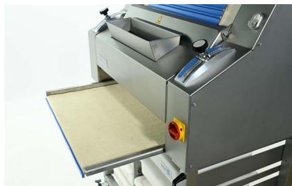
Placa de recogida de acero inoxidable recubierta fieltro de lana en guías.

Moldeadora de baguettes duradera (de acero inoxidable) con 3 rodillos y cintas de fieltro para unas piezas de masa con una forma perfecta