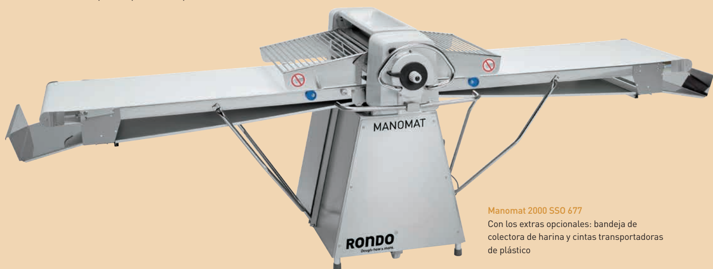
Manomat 2000 SSO 677

Con Manomat y Automat usted procesará rápidamente grandes cantidades de masa. Y también podrá utilizarla sin ningún problema en varios turnos de trabajo al día. Los numerosos detalles estudiados a fondo proporcionan la máxima comodidad en su manejo. El diseño es extraordinariamente robusto, y las superficies lisas de acero inoxidable hacen que se pueda limpiar fácilmente.