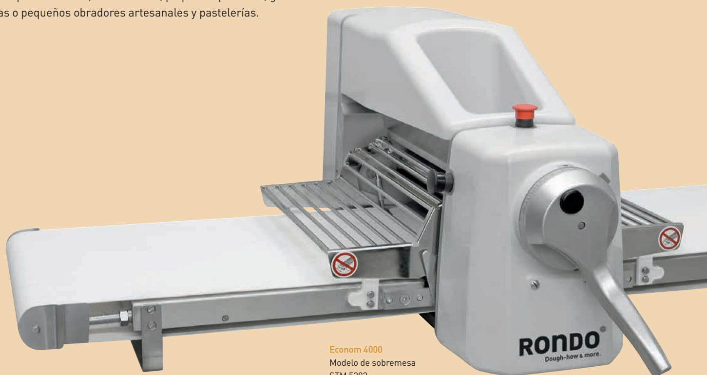
Econom 4000 Modelo de sobremesa STM 5303

Econom lamina la masa cuidadosamente y con gran precisión, y además ocupa muy poco espacio. Con una anchura de trabajo de 500 mm, es la laminadora ideal cuando se dispone de muy poco sitio, por ejemplo en hoteles, restaurantes, pequeñas pizzerías, grandes cocinas o pequeños obradores artesanales y pastelerías.