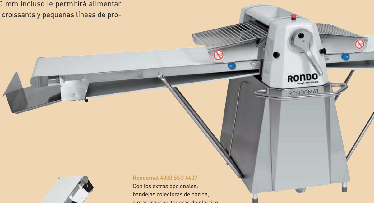
Rondomat 4000 SSO 6407 Con los extras opcionales: bandejas colectoras de harina, cintas transportadoras de plástico

Rondomat es la laminadora ajustada a los obradores pequeños y medianos. Se caracteriza por su construcción robusta y su diseño ergonómico. Con Rondomat, usted procesará cuidadosamente todo tipo de masas y obtendrá bloques y bandas de masa homogéneos. La anchura de trabajo de 650 mm incluso le permitirá alimentar mesas de corte, máquinas de croissants y pequeñas líneas de producción de pastelería.