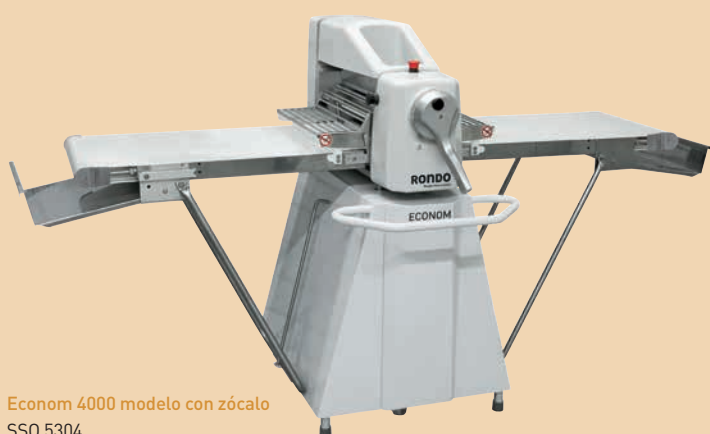
Econom 4000 modelo con zócalo SSO 5304