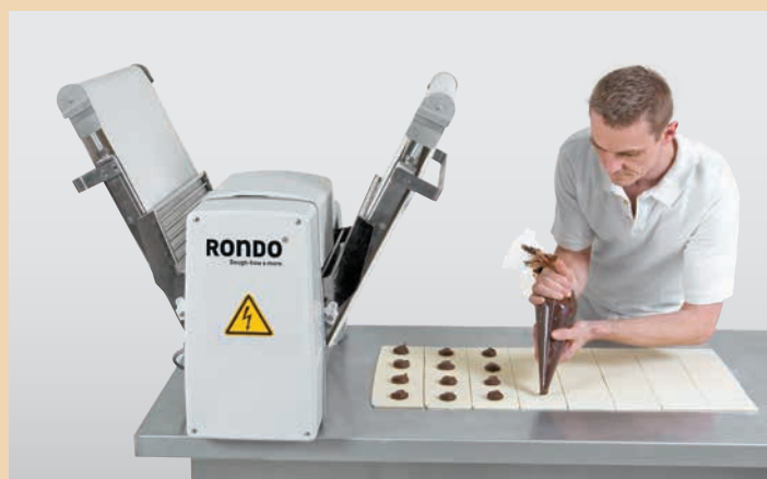
Cuando no la esté utilizando solamente tendrá que plegarla hacia arriba y ganará un valioso espacio para trabajar.